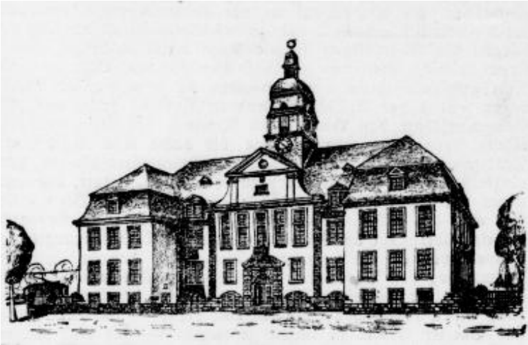
Rathaus der Gemeinde Repelen – Baerl, später Gemeinde Rheinkamp