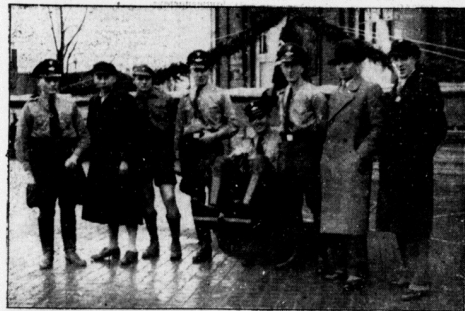
Baugruppe Kepelen vor dem Segling.

fanf die Hüfte vom Stirnholz des Flugzeuges.