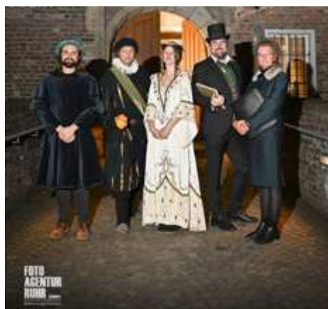
Bild 8: Nacht der Geschichte

Am 23. September 2023 fand - relativ spät im Jahr - die fünfte Nacht der Ge-