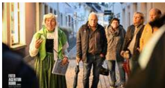
Bild 9: Nacht der Geschichte