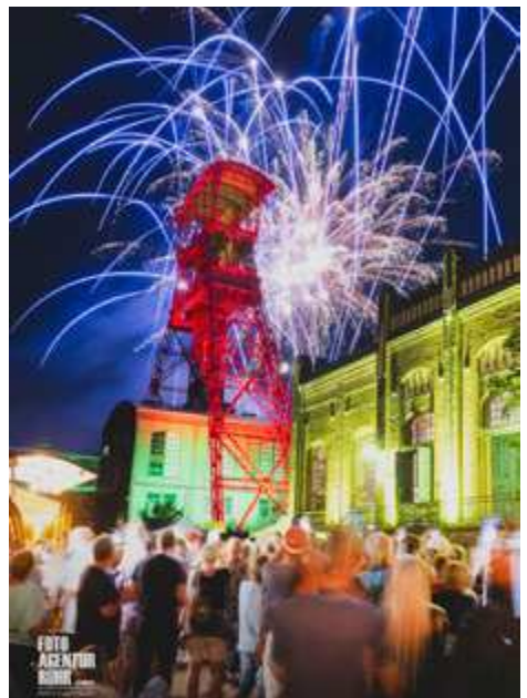
Bild 7: ExtraSchicht Feuerwerk