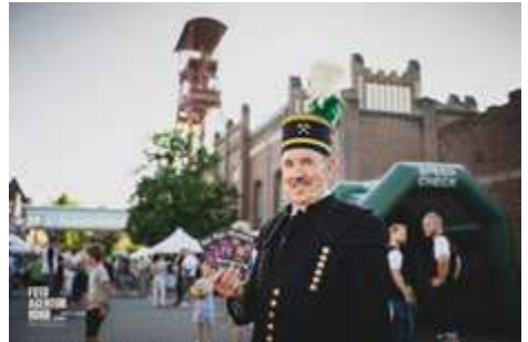
Bild 6: ExtraSchicht Begrüßung

Am 24. Juni 2023 war der Moerser Schacht IV mit dem Industriedenkmal des Fördermaschinengebäudes zum 7. Mal einer der 43 Spielorte der ExtraSchicht, Nacht der Industriekultur im