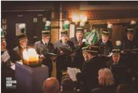
Bild 13: Kerzenkonzert